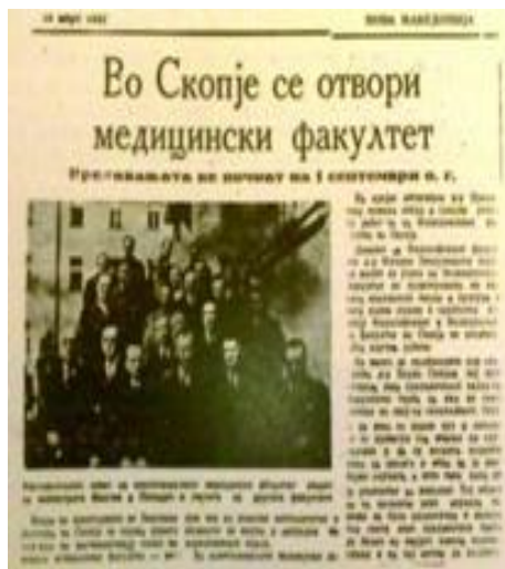
Сл. 1. Факсимил од статијата за отворањето

На 18 март 1947 година, во весниците Политика и Нова Македонија била објавена веста за отворањето на Медицинскиот факултет во Скопје, со што и македонската јавност била информирана за овој значаен момент во образовниот систем на новата македонска држава.