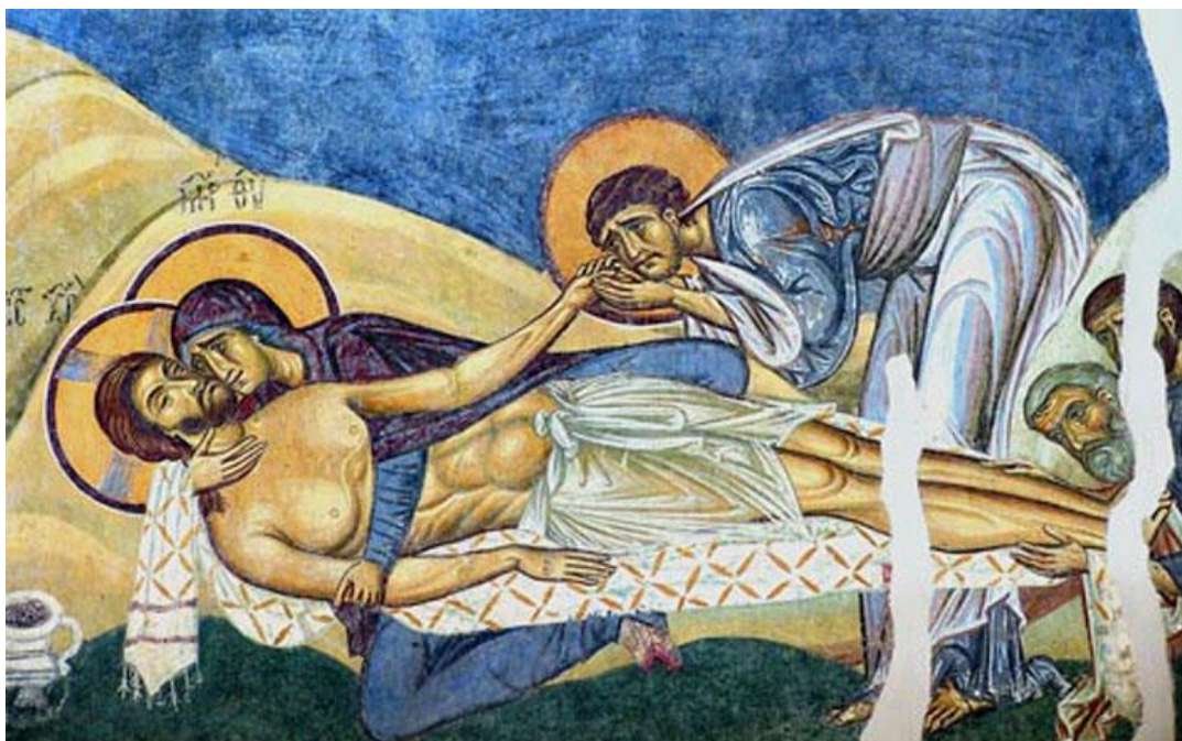
Композицијата Оплакување на Христа од црквата Св. Пантелејмон во Нерези, Скопско

Гледајќи низ призмата на православната еклисиологија, Македонската православна црква – Охридска архиепископија, фактички претставува органски дел од едната света соборна и апостолска Црква. Непобитен факт е дека таа има исклучителна улога во црковно-народното живеење во Република Македонија. Црквата во Македонија не би била во вистинска смисла македонска кога не би ја имала истата судбина на сè друго што го носи предзнакот македонско – народот, јазикот, идентитетот, културата, а тоа е да биде негирана, условена, обесправена, работи што не припаѓаат само на минатото, туку, за жал, се дел и од нашата сегашност. Никој не може да измисли ниту народ ниту Црква. Таа опстојува затоа што е израз на волјата на народот кој ја сочинува и ја сака таква каква што е.