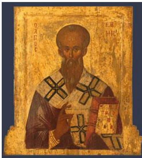
Свети Климент Охридски од крајот на XIV век, црква Света Богородица Перивлепта, Охрид