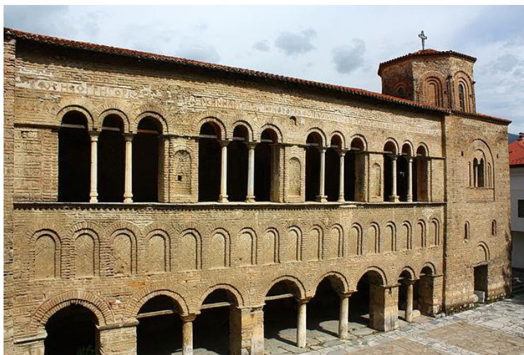
Света Софија – катедрала во стариот дел на градот Охрид, ран XI век

Настаните се одвиваат на следниов начин. Со ослободувањето на одредени територии на Македонија во текот на Втората светска војна и создавањето на првите органи на новата власт, започнува да се размислува за разрешување на македонското црковно прашање. Народноослободителната власт на ослободената територија во своето самоиницијативно организирање ја вклучила и Црквата, за и таа да може да се организира врз македонска основа. Во недостиг на висок клир, кој како туѓински ја напуштил земјата, македонското свештенство пред самиот крај на војната, во 1944 година во селото Врановци го создава Иницијативниот одбор за организирање Македонска православна црква.