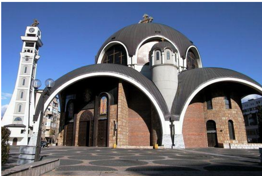
Архиепископскиот соборен храм Свети Климент Охридски во Скопје

Значи, дијацезата на МПЦ не се протега само на подрачјето на македонската држава, туку и во црковните општини надвор од границата на Република Македонија. Со парохиите моментално управуваат 11 митрополити и еден викарен епископ, на кои им помагаат над 500 активни свештеници.