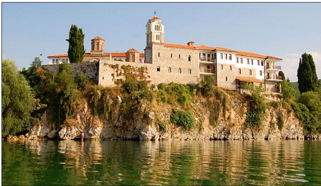
Манастирот Свети Наум на Охридското Езеро

Во мај 1962 година, во придружба на патријархот Герман со неколку епископи на СПЦ, во посета на МПЦ дошол патријархот московски Алексеј, придружуван од митрополитот Никодим, епископот Пимен и повеќе високодостојници на Руската православна црква. На празникот на свети Кирил и Методиј во црквата Пресвета Богородица – Каменско во Охрид била одржана и архиерејска литургија, на којашто служел патријархот московски Алексеј во сослужение на патријархот српски Герман и архиепископот охридски и македонски Доситеј. Ова било прво сослужување на поглаварот на МПЦ со поглавари од други автокефални цркви.