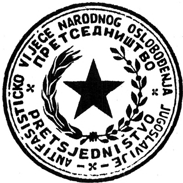
Факсимил на печатот на Претседателството на АВНОЈ

Истакнуваме дека покрај овие, биле донесени и други одлуки, бил избран президиум (претседателство) од 55 членови. Претседателството го именувало Националниот комитет на ослободувањето на Југославија. Избрана била Комисија за утврдување на воените злочини. Националниот комитет бил највисок извршен и законодавен орган на народната власт во Југославија преку кој АВНОЈ ја остварувал својата извршна власт. Националниот комитет ги имал сите обележја на народна влада. За својата работа НК одговарал пред АВНОЈ. Тој се состоел од претседател, три потпретседатели и соодветен број повереници. Од дијафилмот на учениците им го прикажуваме шематскиот приказ на АВНОЈ и неговите органи.