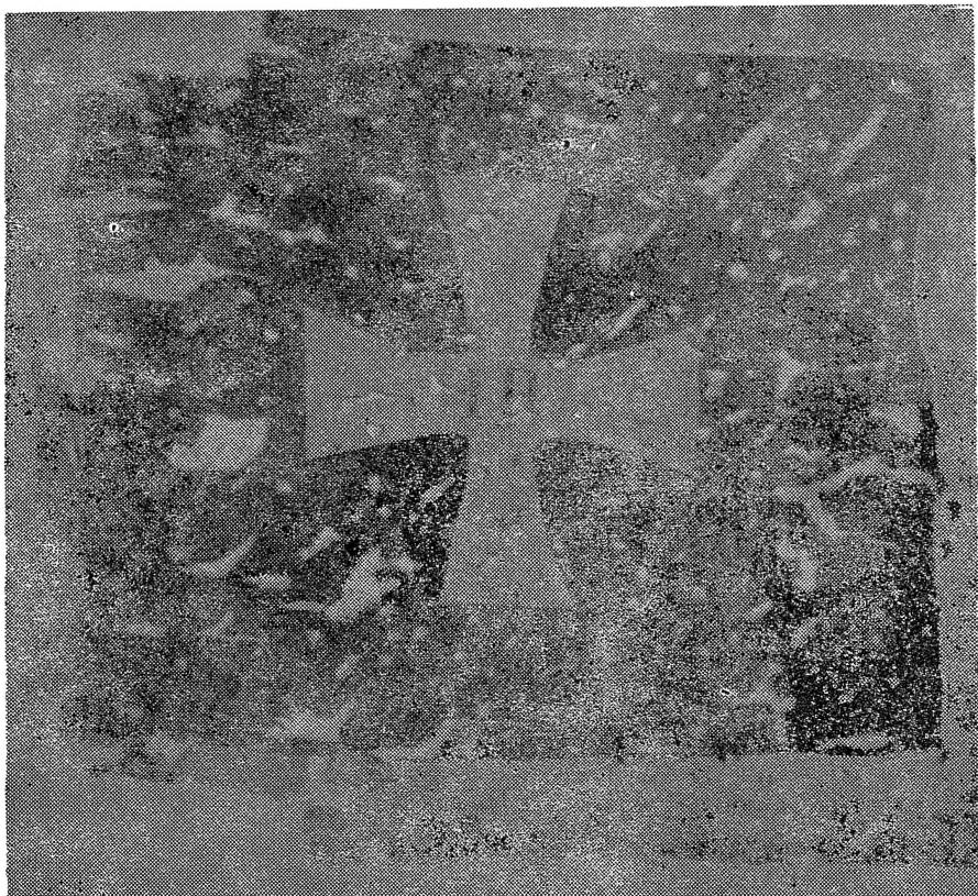
Сл. 3. Црногорско знаме на чета од битката на Вучји Дол.

Ниту овие вечни отпадници од властите, а во овој „велји рат“ фанатични турски патриоти, Зејбеци, не можеа да одолеат на црногорските јуриши. Во многубројните судрувања нивните одреди беа десткувани и само мал број од зејбечките борци се вратија во своите анадолски планини 10) .