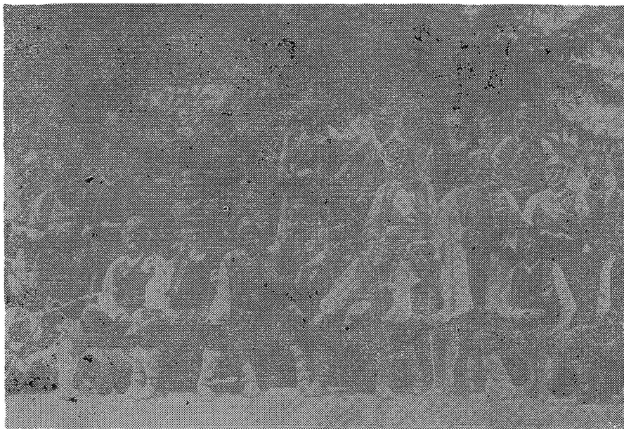
Сл. 1. Учесници во борбата кај Грахово по повод на 50-годишнината од борбата

Во извештајот до рускиот конзул во Дубровник, за судирот кај Салковини Његош меѓу останатото пишува: „Сите наши старци, па дури и самите Турци признаваат дека во овие краишта уште никогаш помала шака луѓе така храбро не се покажала против толку голема сила. И навистина овој настан ќе остане како огледало во црногорските летописи“. 4)